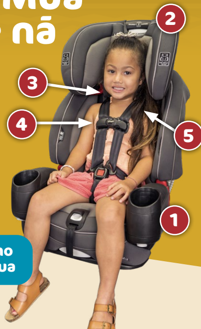
Ka Noho Huli Mua