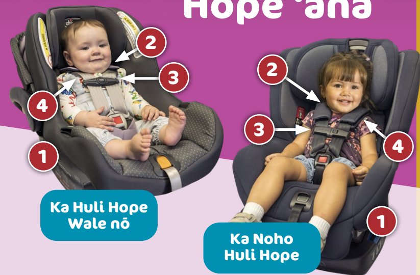
Ka Huli Hope Wale nō