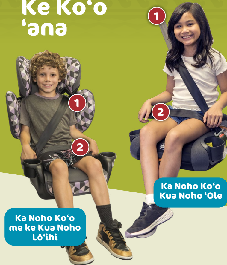
Ka Noho Ko'o me ke Kua Noho Lō'ihī